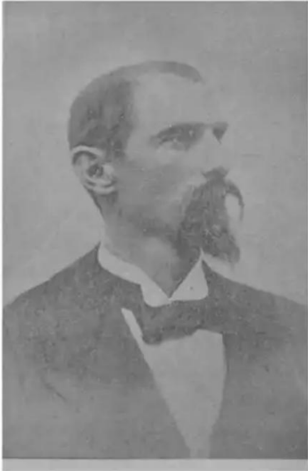
الجاوس الفرنسى . . . إميل جنينيل